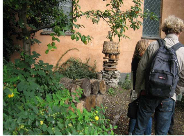
Detalje fra Natrværkstedet: Habitater for solitærbier og andet insektliv.

Fredag den 5.oktober 2007. Det lange møde kl. 12-17: