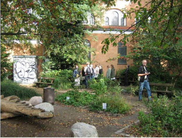
Naturværkstedet i Saxoparken, som er etableret på initiativ af Grøn Vesterbro.